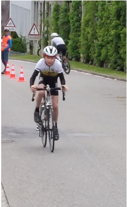
Auch auf der Strasse ist Ausbildung angesagt.