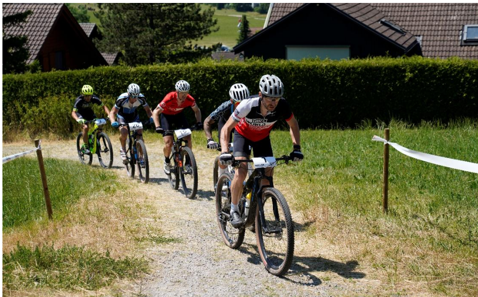
Der Aufstieg zum Schlosshügel fordert den Fahrern alles ab.