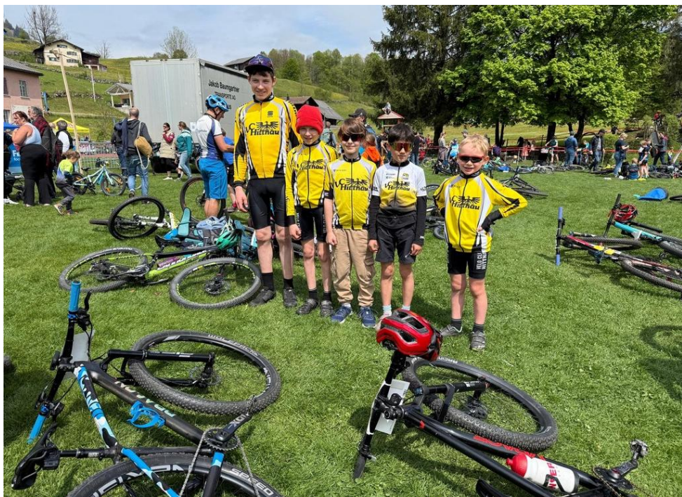
Stolzer Nachwuchs: Cycling Eagles posieren am Bikerennen in Schwändi.

Die Cycling Eagles wachsen, und mit ihnen der Anspruch, unseren Kindern und Jugendlichen ein abwechslungsreiches, altersgerechtes und motivierendes Training zu bieten. Besonders erfreulich: Immer mehr Kinder wagen sich an Rennen, zeigen Ehrgeiz und Freude am sportlichen Wettkampf. Auch eine kleine, aber sehr ambitionierte Gruppe Jugendlicher misst sich regelmässig erfolgreich auf Strasse, Bike und Bahn.